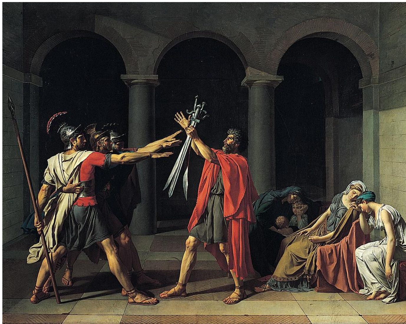
Il Giuramento degli Orazi , olio su tela, 330x425 cm, 1784.